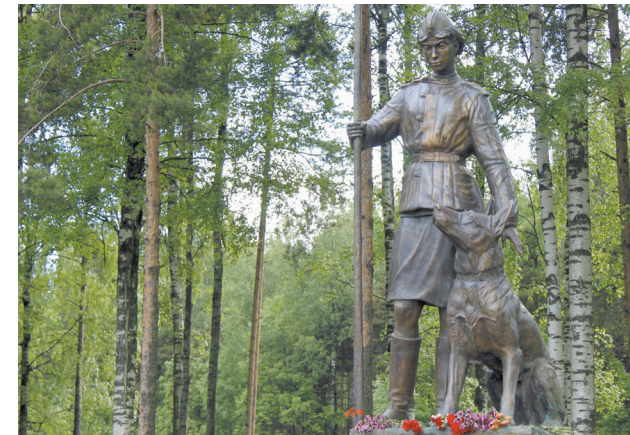
Памятник военным дрессировщикам и служебным собакам ленинградского фронта в парке Сосновка

фундаменте мину с часовым механизмом. Мохнатый герой дожил до глубокой старости и был похоронен с воинскими почестями.