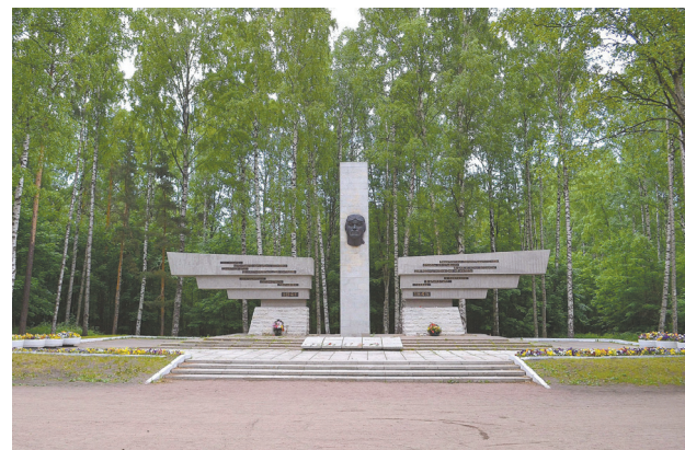
Памятник защитникам ленинградского неба в парке Сосновка

На аэродроме базировались несколько полков: 44-й бомбардировочный авиаполк (с 22.11.1942 – 34-й гвардейский), 159-й истребительный, 44-й истребительный (с 7.03.1942 – 11-й гвардейский), 26-й