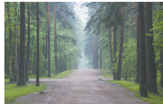
Аллея парка Сосновка

огромный вклад в победу осажденного Ленинграда над жестоким врагом, спасли тысячи жизней.