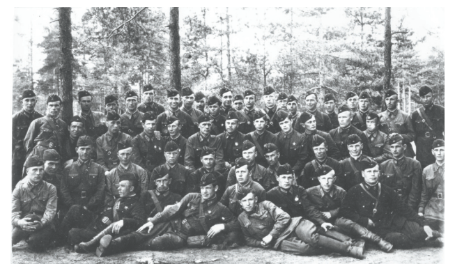
Групповая фотография личного состава 44-го скоростного бомбардировочного авиаполка. Аэродром Сосновка. Ленинградский фронт