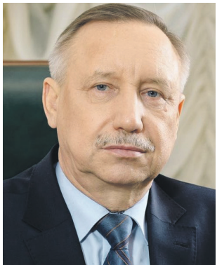
Александр БЕГЛОВ, губернатор Санкт-Петербурга