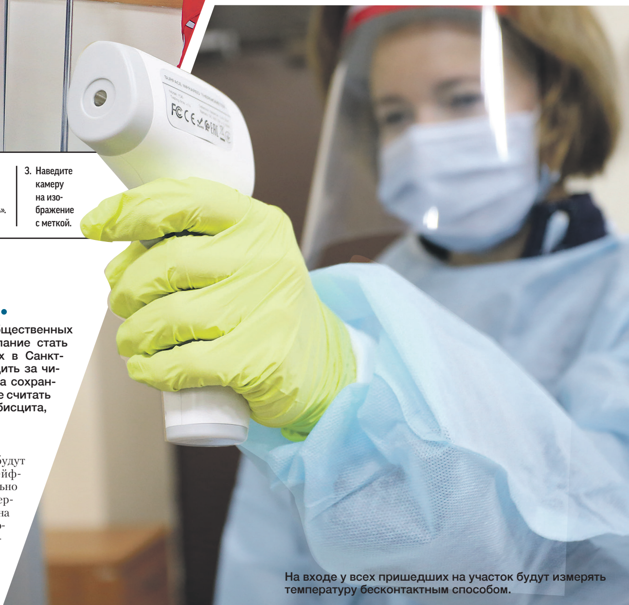
На входе у всех пришедших на участок будут измерять температуру бесконтактным способом.